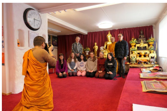
Bilde 4 Besøk til thai-buddhistisk senter i Alvøen