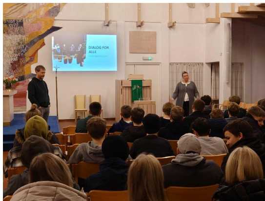
Bilde 5 Workshop i Olsvik kirke

Som en del av vår jobb er det å sette ungdom i stand til å møte mangfold og reflektere rundt fordommer, toleranse og bruke dialog som verktøy. Derfor tilbyr vi workshop i religionsmangfold i Bergen og dialog for ungdommer. Disse kveldene skreddersys etter samtale med de som kontakter oss etter som hva de erfarer som rører seg i ungdomsmiljøene. Kvelden består av en innledning fra dialogsenderet og to deler dialogøvelser før vi avslutter med felles refleksjoner. I 2023 hadde vi en kveld i Olsvik kirke og en i Sælen kirke for konfirmanter. Ungdommene viste stor vilje og nysgjerrighet. De var også flinke til å dele egne erfaringer og refleksjoner med gruppene de var i. På disse kveldene har vi nådd ut til ca 140 ungdommer.