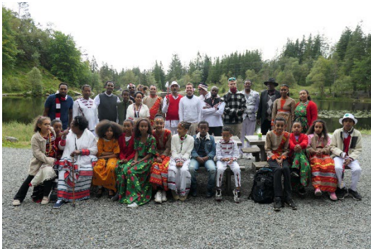
Bilde 3 Feiring av irreecha ved Skomakerdiket på Fløyen med Waaqeffanna