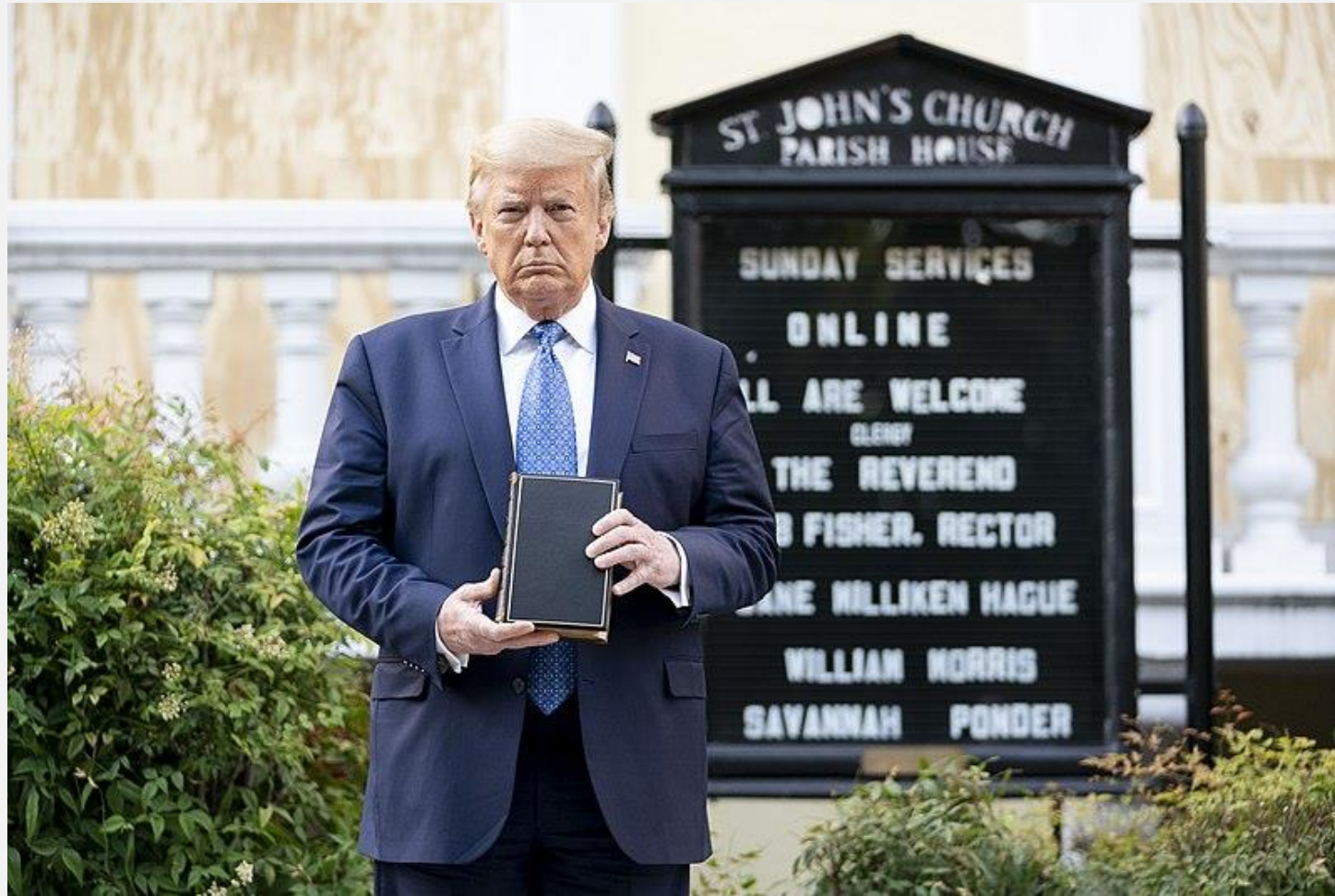
Official White House Photo by Shealah Craighead) Transferred from Flickr via #flickr2commons 4.3.2022