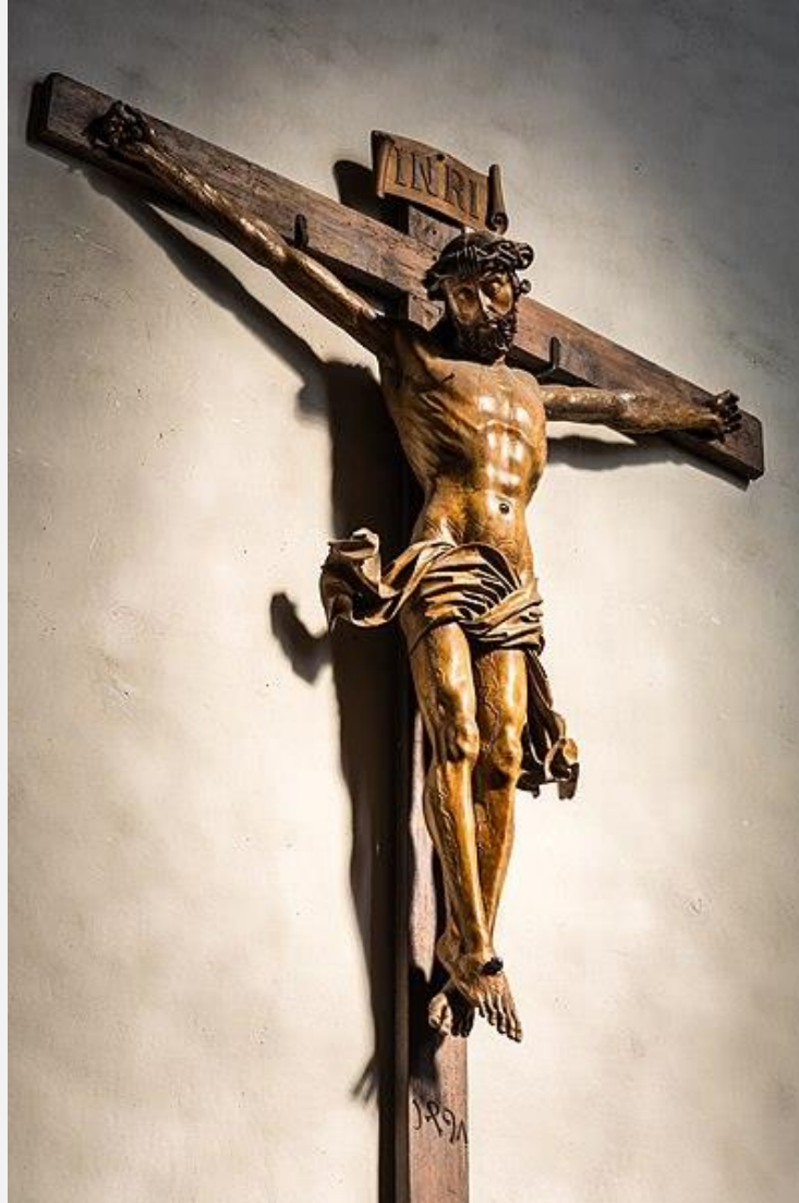
Crucifix at the parish- and pilgrimage church Kefermarkt , Upper Austria cc creative commons liscence: Creative Commons Attribution-Share Alike 4.0 Credit: Uoaei I